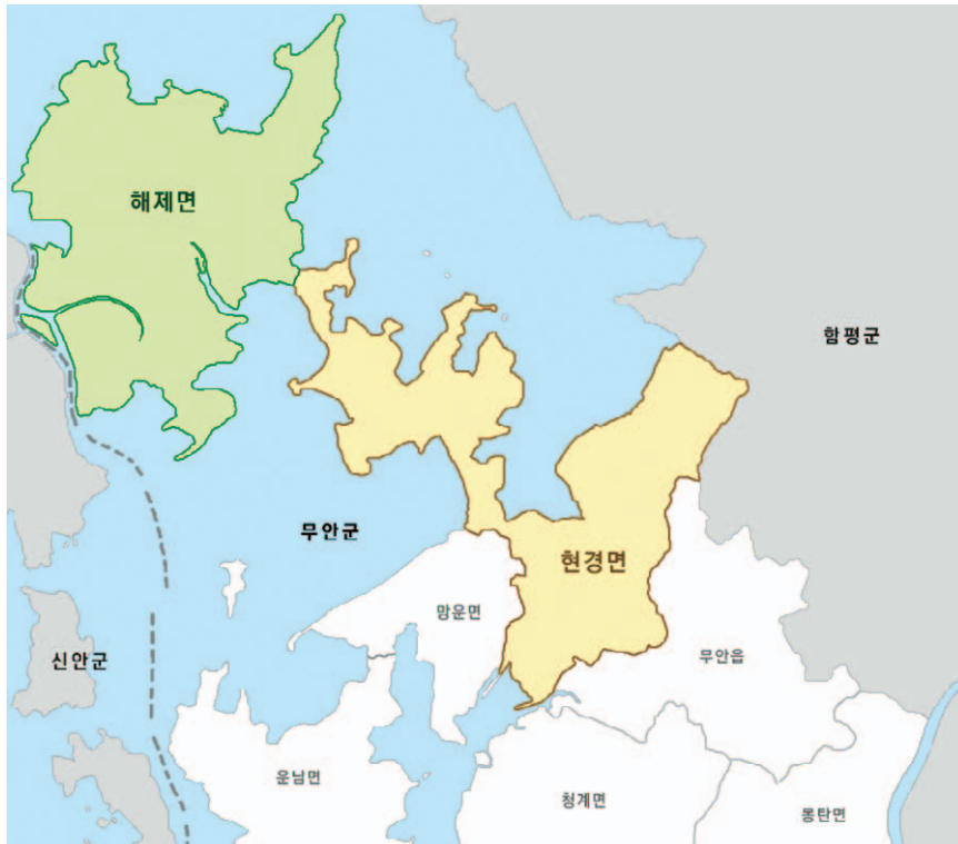
[그림 1] 조사 지역(무안군 해제면, 현경면)

농가를 방문하여 조사의 취지를 설명하고, 농가에서 보유하고 있는 토종 종자 견본을 소량 수집했다. 종자를 관찰하면서 재배농민과 종자의 내력 및 특성에 관한 인터뷰를 실시했고, 생육 중인 작물의 경우 포장에 가서 직접 관찰하고 특성을 살폈다.