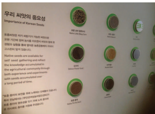
*2015 국제농업박람회 농업생명관(2015)

다음으로 조사한 자료를 활용하여 다양한 공간에서 토종유전자원의 중요성을 알리고, 토종 종자지킴이운동에 동참을 호소할 수 있다. 실제로 무안의 토종 종자들이 전남 지역의 기관과 국제적인 농업 행사에 전시되어 우리 종자를 알리고, 토종 종자 보존의 필요성을 알리는데 한몫을 하고 있다.