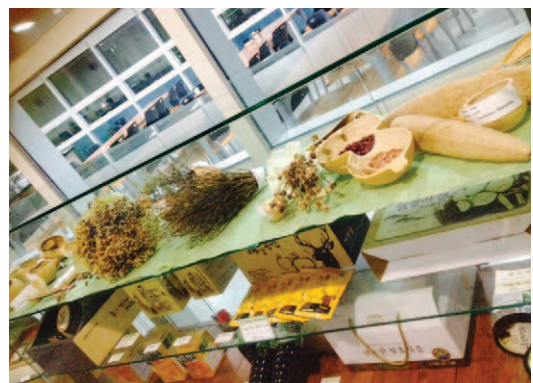
*전남여성플라자 3층 상설전시장(2014)