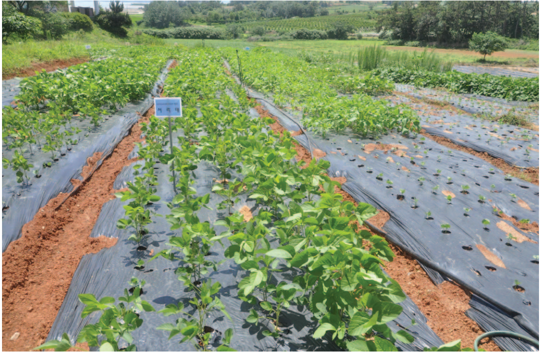
[그림 3] 무안군 여성농어업인센터 채종포(2014)